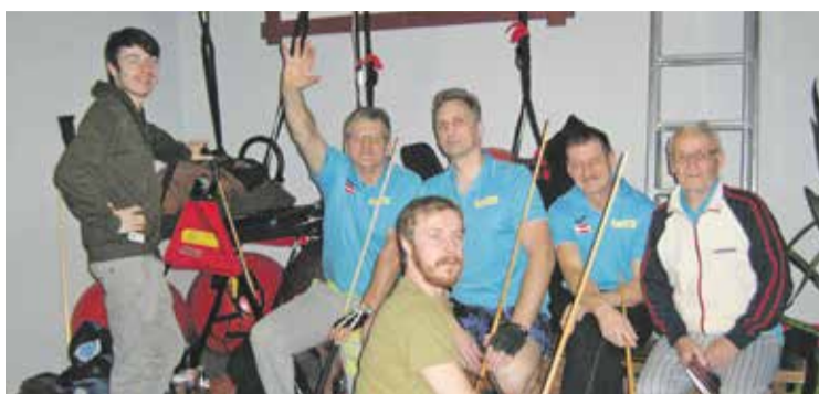
FOTO: Jelgavas novada Novusa kluba komanda «Avangards» Latvijas komandu čempionāta novusā 1. līgā izcīnīja 2. vietu, iekļūstot to trīs komandu vidū, kuras no 1. līgas nākamgad pāriet spēlēt čempionāta Augstākajā līgā.

Komandas kapteinis stāsta, ka Latvijas komandu čempionātā novusā Jelgavas novads ir pārstāvēts jau 8 gadus un šobrīd čempionātā konkurence ir liela – tajā piedalās 56 komandas, spēlējot Augstākajā, 1., 2. un Atlases līgā. «Ja pirms 8 gadiem par mums brīnījās – kas tas «Avangards» ir –, tad šobrīd jau ar