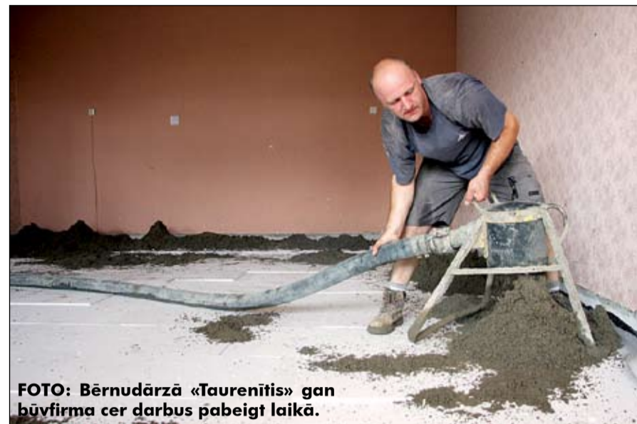
FOTO: Bērnu darzā «Ļaurenītis» gan būvuzraugs cer darbus pabeigt laikā.

Piemēram, Kalnciema pilsētas vidusskolā paralēli āršieni siltināšanai ir jānomaina ļoti liels skaits logu, bet augusta sākumā pat tas vēl nebija sākts darīt. «Ir skaids, ka objektā, kur strādā