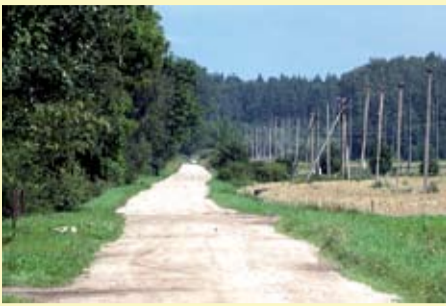
Autoceļu uzturētājs, un projekta kopējās izmaksas ir 67 921, 09 lati.

infrastrukturā bojājumu cukura rūpniecības restrukturizācijas skartajā reģionā. «Jāatzīst, ka ceļš ir sliktā stāvoklī, jo īpaši pēc pavasara plūdiem, kas to vairākās vietās arī nedaudz izskaloja. Pēc rekonstrukcijas būs divtiklieli ieguvēji, jo šis ceļa posms ne tikai tiks noasfaltēts, bet uzlaboti arī abi tirti, kas ir šajā ceļa posmā,» tā pārvaldes vadītāja. Darbus veic «Latvijas