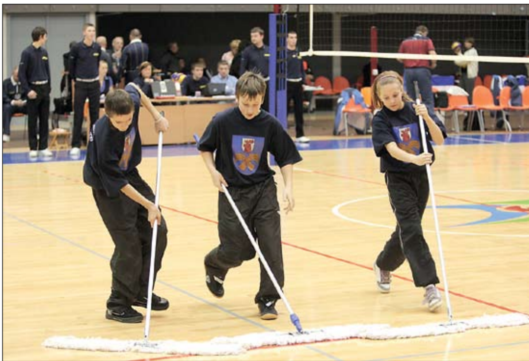
FOTO: Eiropas jauniešu volejbola čempionāta 2. kvalifikācijas kārtā tiesnešu palīgus pildīja topošie Jelgavas novada volejbolisti. Lai gan kādam var šķist, ka padot bumbas, noslaucīt laukumu, pacelt karogus ir nieks, darbs ir ļoti atbildīgs, un skolēni pret to izturējās nopietni.

Eiropas jauniešu volejbola čempionāta 2. kvalifikācijas kārtā piedalījās un par iekļūšanu finālā cīnījās Latvijas, Nīderlandes, Beļģijas, Anglijas, Slovākijas un Vācijas U-18 puīšu izlases. Tāpēc volejbola treneri augstu vērtē arī to, ka jaunajiem bija iespēja vērot, kā spēlē tādu volejbola lielvalsti kā Nīderlandi, Beļģiju un Vāciju jaunieši. «Dalība šajā čempionātā sko-