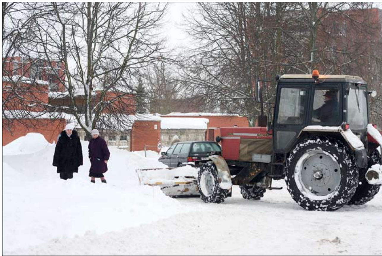
FOTO: Līdz ar viena komunālā uzņēmuma izveidi novadā paredzēts, ka viena no tā funkcijām būs arī ceļu un teritorijas uzturēšana. Jau šobrīd ar esošajiem komunālajiem uzņēmumiem ir noslēgti līgumi par ielu un ceļu ikdienas uzturēšanu ziemas periodā.

Ar mērķi visā Jelgavas novadā veidot vienotu, finansēs un kvalitātes kontrolē koordinētu ūdenssaimniecības un komunāltehnisko pakalpojumu sniedzēju Jelgavas novada domes sēdē nolēms līdzšinējās piecas sabiedrības – SIA «Kalnciema nami», «Glūdas komunālā saimniecība», «Apsaimniekošanas serviss», «Stalģenes komunālais dienests» un «Paligs L» – apvienot vienā.