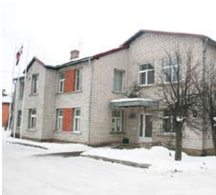
FOTO: Uzņēmējiem ir iespēja Biznesa inkubatorā Elejā nomāt ar mēbelēm un tehniku aprīkotas biroja telpas. Kopējā telpu platība ir 77,7 kvadrātmetri, nodrošinot sešas darba vietas – vienam uzņēmumam ne vairāk kā divas.