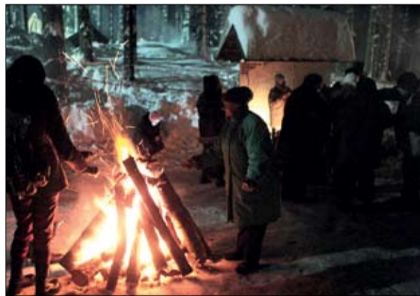
FOTO: Šajā vakarā pie atmiņu ugunskuriem izskanēja ne viena vien patriotiska dziesma, kas raisa pārdomas, – «Zībsni zvaigzne aiz Daugavas», «Div' dūjiņas gaisā skrēja», «Es karā aiziedams» un citas.