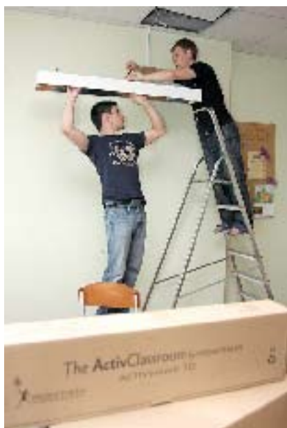
FOTO: Jelgavas novada Neklāties vidusskolas Svētes konsultāciju punkta dabaszinātņu kabinetos jau sāk uzstādīt aprīkojumu – apgaismes ķermeņus, interaktīvās tāfeles, datorus.