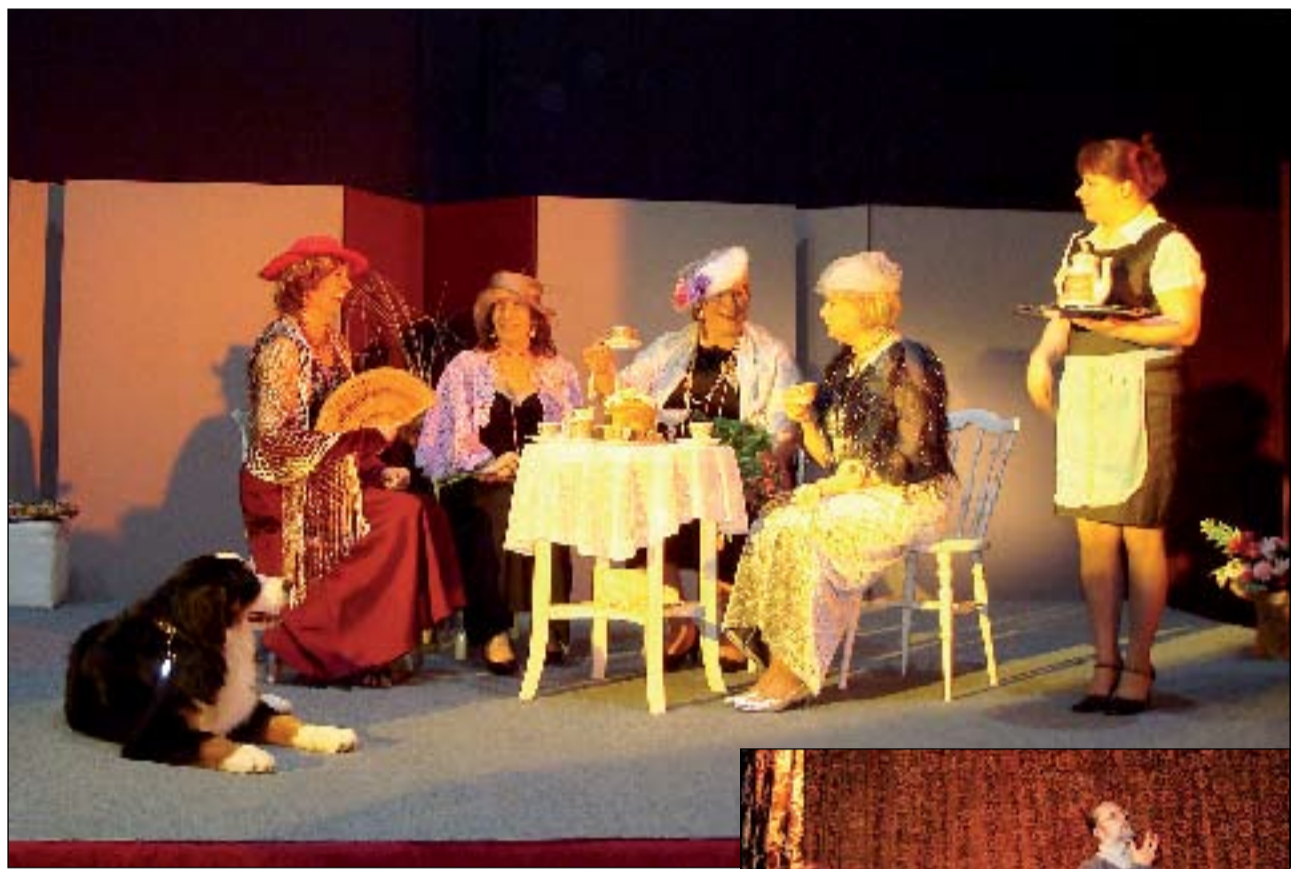
FOTO: Vilces amatierteātra kolektīvs nedēļas nogalē Amatierteātru salidojumā Balvos piedalīsies ar Leldes Stumbres lugu «Svētdienas vakars» (mazajā bildē), bet valgundnieki, kuriem šis būs pirmais salidojums, sagatavojuši Annas Brigaderes «Čaukstenes».