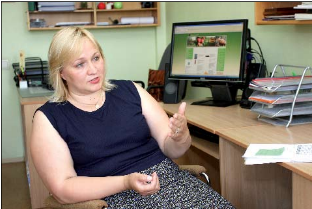
FOTO: Vispieprasītākie sociālās palīdzības veidi saistīti ar veselības uzlabošanu, kā arī brīvpusdienas, GMI un dzīvokļa pabalsts. Arī vislielākie līdzekļi tiek tērēti ēdināšanai jeb brīvpusdienu nodrošināšanai novada skolēniem. Savukārt vismazāk naudas izlietots aprūpes un veselības aprūpes pabalstam.

Tiesa gan – jau pašlaik izkristalizējušies jautājumi, kas šajā jomā būtu jāuzlabo un pie kā jāstrādā turpmāk. Piemēram, mēs spējam nodrošināt visas Ministru kabineta noteiktās prasības, taču, redzot reālo situāciju, apzināmies, ka palīdzība būtu nepieciešama krietni plašākam cilvēku lokam, taču viņiem tā nepienākas, jo neiekļaujas noteiktā kategorijā. Protī, lēmums par palīdzību vai pakalpojumu tiek pieņemts stingri pēc saistošajiem noteikumiem noteiktajiem kritērijiem, kas atsevišķiem pabalstu veidiem ir ļoti ierobežojoši. Tieši tādēļ būtu nepieciešams izvērtēt šos kritērijus, paplašinot pabalstu saņēmēju «sietu», jo, lai saņemtu, piemēram, GMI, dzīvokļa pabalstu, šis «sietis» ir ļoti smalks, tādējādi palīdzība tiek liegta virknei cilvēku, kam tā patiesi būtu nepieciešama.