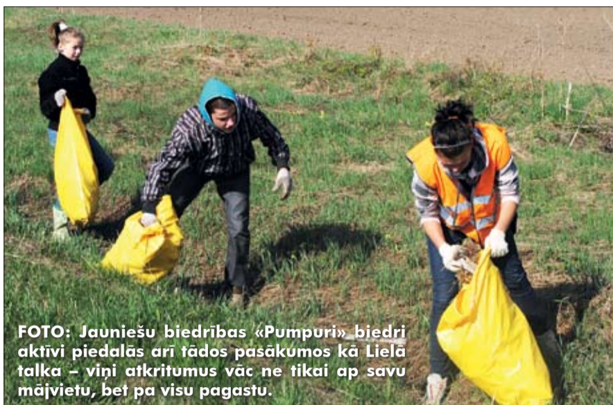
FOTO: Jauniešu biedrības «Pumpuri» biedri aktīvi piedalās arī rādās pasākumos kā Lielā talkā – viņi atkritumus vāc ne tikai ap savu mājvietu, bet pa visu pagastu.