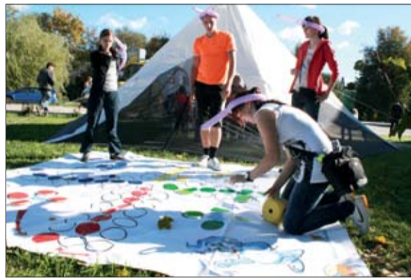
FOTO: Pirmajās novada Jauniešu dienās, kas oktobra sākumā notika Vircavas pagastā, piedalījās vairāk nekā simts jaunieši. Pasākuma iniciatori bija paši novada jaunieši, kuri ir sapratuši – visiem kopā ir daudz vieglāk un interesantāk padarīt savu dzīvi krāsaināku. Tā organizators bija Jaunatnes padome, kuras «dienas kārtība» nu ir otrā jauniešu foruma rīkošana – tas notiks 24. novembrī pulksten 14 Jelgavas novada domes ēkā Jelgavā, un šoreiz tēmas: jaunieši un neformālā izglītība, jaunieši un viņu piederība novadam un pagastam.

biedrības un nodibinājumi, kas veic darbu ar jaunatni. Liela loma ir arī izglītības iestādēm un dažādiem centriem, kas nodrošina kvalitatīvas brīvā laika pavadīšanas iespējas.