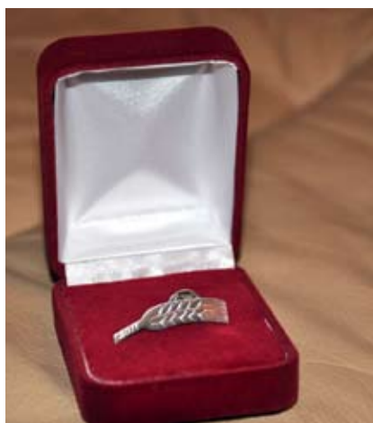
FOTO: Goda diploma saņēmējiem tiks pasniegta apzeltīta vārpa piespraude, savukārt Atzinības raksta saņēmējiem – sudraba vārpa kā Jelgavas novada bagātības simbols.