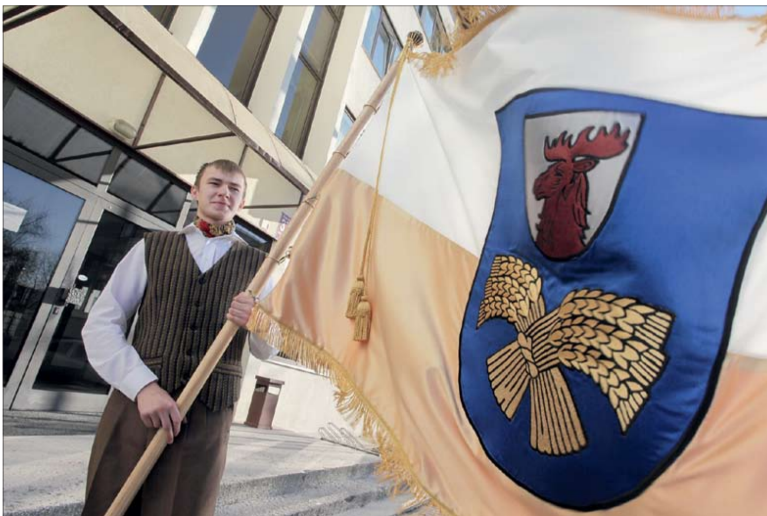
FOTO: Jelgavas novada oriģinālo karogu, kurā uz balta un zeltīta fona izšūts novada ģerbonis, darinājusi māksliniece Rudīte Grasberga. Šo karoga eksemplāru izmantos tikai svinīgos pasākumos un godināšanas gadījumos. Taču novada karogs līdzās valsts karogam turpmāk arī pastāvīgi būs pacelts mastā pie domes ēkas.

Mastā pie Jelgavas novada pašvaldības ēkas līdzās Latvijas valsts karogam nu pastāvīgi plīvos arī mūsu novada karogs, uz kura atainots Jelgavas novada ģerbonis uz balta un zeltīta horizontāli dalīta fona. Dienu pirms valsts svētkiem Svētās Annas baznīcā Jelgavā iesvētīs ar roku darināto karogu, kurš tiks izmantots īpašās svētku un godināšanas reizēs.