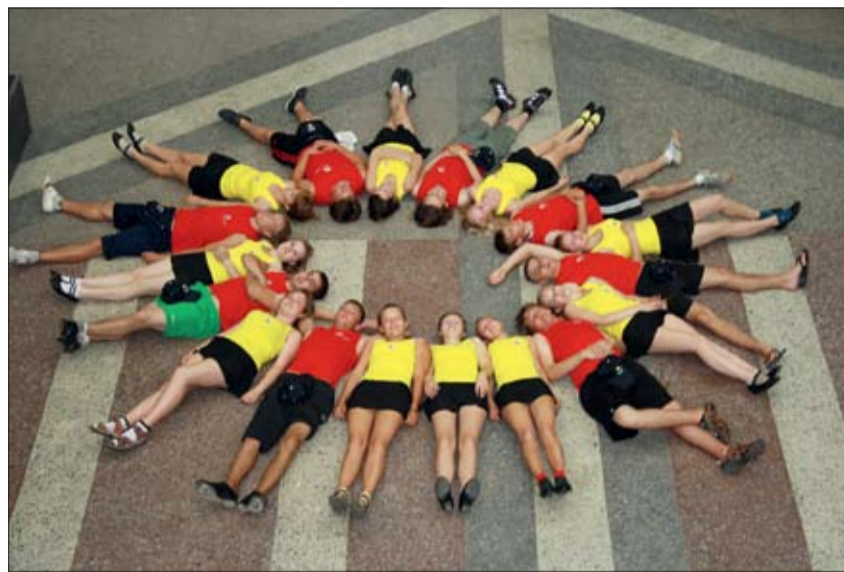
FOTO: Šī bilde tapusi X Skolēnu dziesmu un deju svētku laikā 2010. gadā un atgādina jauniesu deju kolektīva «Tracis» logo.

Pa šiem gadiem kolektīvs piedalījies gan Dziesmu un deju svētkos, gan dažādos konkursos un skatēs, kur izcīnītas godalgas, gan koncertējis ārzemēs. Pašlaik tiek cītīgi strādāts pie jaunā Deju svētku repertuāra, bet pavisam drīz kolektīvs sāks gatavoties arī jubilejas pasākumam, kas notiks aprīlī, un arī ārzemju ceļojuma koncertprogrammai. Līdzās