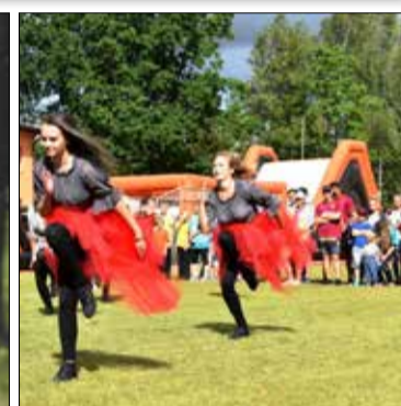
FOTO: Atklāšanas parādē novada Sporta svētku dalībniekus ar atraktīviem priekšnesumiem priecēja Valgundes mūsdienu deju dejotāji.