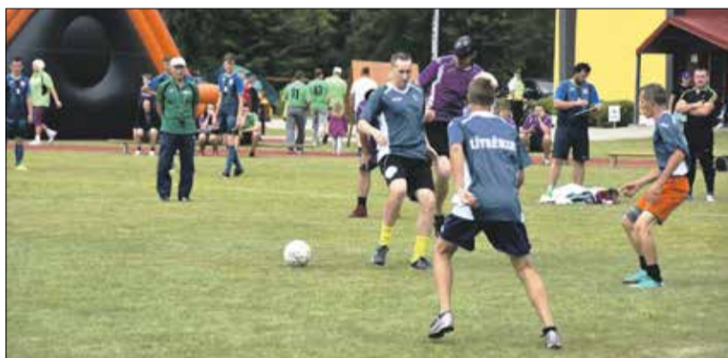
FOTO: Neatņemama Sporta svētku sastāvdaļa ir futbols – 3. vietu šogad izcīnīja Līvberzes komanda.