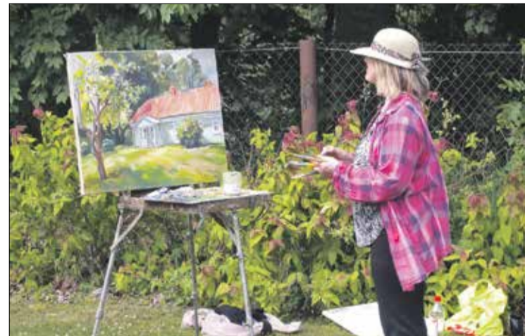
FOTO: Par godu izcilā latviešu mākslinieka Ģederta Eliasa 130. dzimšanas dienai jūnijā beigās Jelgavas mākslinieki ar draugiem tikās plenērā Ģ.Eliasa dzimtas mājās «Zilēni» Platonē, lai gleznās iemūžinātu tuvāko apkārtni. Kas viņiem sanācis, ikviens varēs novērtēt jubilejas pasākumā 9. septembrī «Zilēnos».

Paredzēts, ka ciemiņiem «Zilēnos» tiks demonstrēta arī Latvijas Mākslas izstāžu hronikas dokumentālā filma