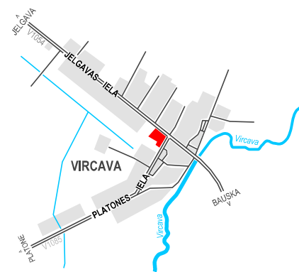
LOKĀLPLĀNOJUMA TERITORIJAS ATRAŠANĀS VIETA