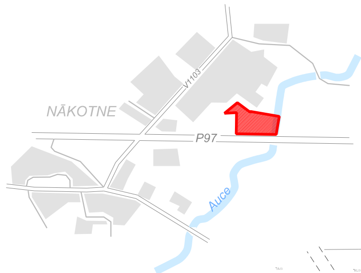
LOKĀLPLĀNOJUMA TERITORIJAS ATRAŠANĀS VIETA