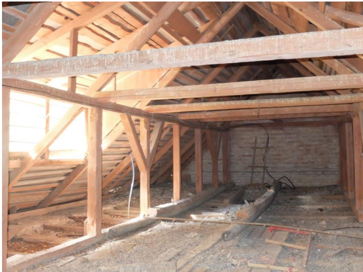
Foto_3.1 (Aukstie bēniņi)

Vēsturiskais jumta segums bijis dakstiņu, laika gaitā tas nomainīts uz skārda lokšņu materiālu. Ir mainīts jumta sākotnējais izkats, izbūvējot jumta vēdināšanas logus. Nesošā jumta konstrukcija spriežot pēc šķērgriezuma izmēriem nav mainīta. Jumtam visiem korpusiem izveidotas lietus ūdens horizontālās un vertikālās notekas.