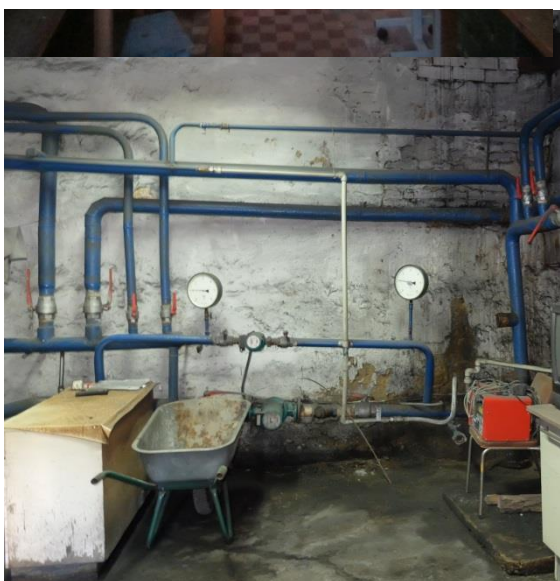
Pagrabstāva telpa. Katlu telpa.