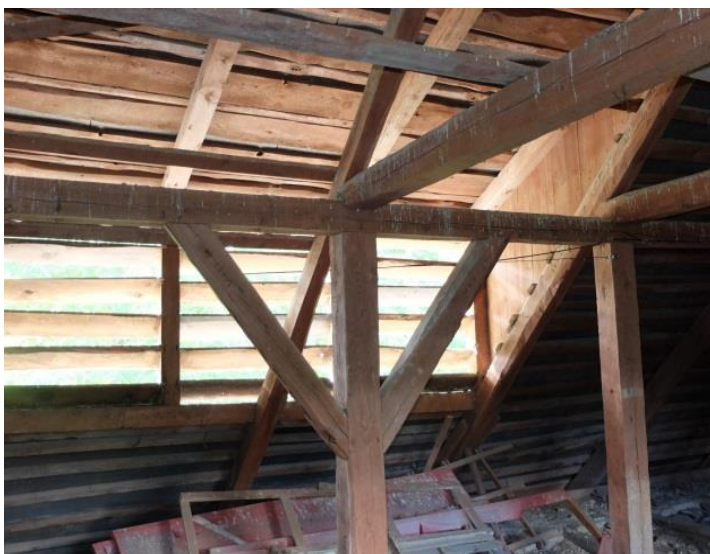
Foto_3. (Auksto bēniņu vēdināšanas logi)