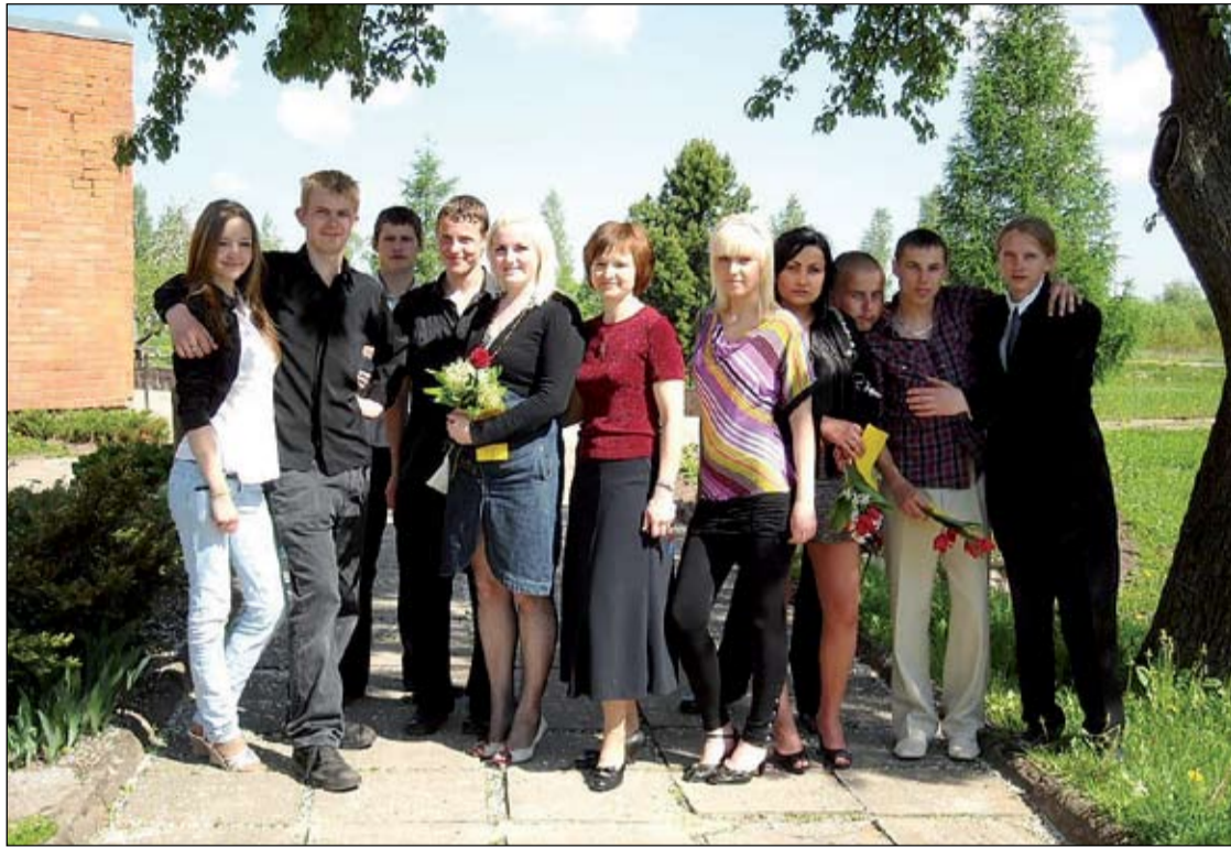
FOTO: Salīdzinot A, B un C līmeņa rezultātu īpatnību centralizētajos eksāmenos mūsu novada vidusskolās, visaugstākie sasniegumi ir Līvberzes vidusskolai, kurā 56,8 procenti 12. klases audzēkņu saņēmuši A, B un C līmeņa sertifikātus.

konkrētos mācību priekšmetos, tad par labiem rezultātiem jāuzteic Kalnciema pilsētas vidusskola krievu valodā (vidējais apguves līmenis 78,7%) un vēsturē (61,9%), Vircavas vidusskola latviešu valodā (60,3%) un angļu valodā (51,5%), bet matemātikā visaugstākie rezultāti ir Elejas vidusskolai (41,1%),» tā E.Fišere.