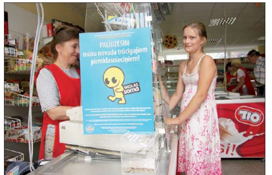
FOTO: Lai palīdzētu skolai sagatavoties vairāk nekā 70 novada trūcīgo ģimeņu pirmklasniekiem, Jelgavas novada Atbalsta biedrība uzsākusi akciju, kuras laikā katrā pagastā veikalos izvietotas ziedojumu kastītes. Tajās savu ziedojumu naudas veidā var iemest ikviens novada iedzīvotājs. Pēc tam par saziedotajiem līdzekļiem tiks iegādāti mācību materiāli šiem pirmklasniekiem.

Tā kā biedrība vēl ir jauna, tai šobrīd at-