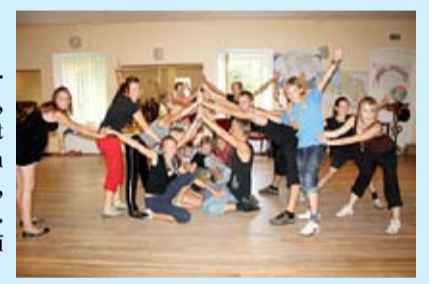
FOTO: «Jaunlidumos» notikusi novada pašvaldības atbalstīta atpūtas un piedzīvojumu nometne «Apkārt zemeslodei», kas pulcināja vairāk nekā 30 jauniešus no visa novada. Desmit dienu laikā skolēni iepazīni dažādas pasaules valstis un kontinentus – to tradīcijas, paražas, dejas, dziesmas, vēsturi, kā arī izgatavojuši dažādas lietas, kas raksturo katru valsti. Nometnes dalībnieki atzīst, ka uzzinātais noteikti noderēs arī skolā mācībām.