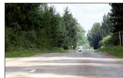
FOTO: «Latvijas valsts ceļi» plāno jau šogad uz Jelgavas – Kalnciema ceļa sakārtot 7,7 kilometru garo posmu – no pilsētas robežas līdz pat Valgundē. Šeit gan pirms diviem gadiem atsevišķi posmi jau tika laboti.

Tuvāko gadu laikā «Latvijas valsts ceļi» plāno īstenot ceļa seguma pa-