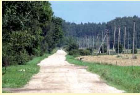
Autoceļu uzturētājs, un projekta kopējās izmaksas ir 67 921, 09 lati.

infrastrukturā bojājumu cukura rūpniecības restrukturizācijas skartajā reģionā. «Jāatzīst, ka ceļš ir sliktā stāvoklī, jo īpaši pēc pavasara plūdiem, kas to vairākās vietās arī nedaudz izskaloja. Pēc rekonstrukcijas būs divtiklieli ieguvēji, jo šis ceļa posms ne tikai tiks noasfaltēts, bet uzlaboti arī abi tirti, kas ir šajā ceļa posmā,» tā pārvaldes vadītāja. Darbus veic «Latvijas