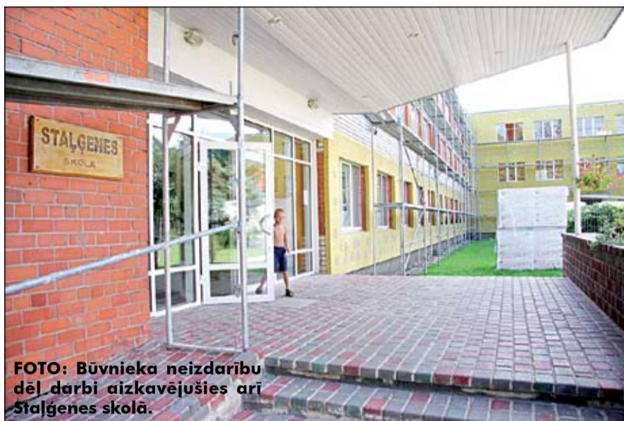
FOTO: Būvnieka neizdarību dēļ darbi aizkavējušies arī Staļģenes skolā.

Mazāk problēmu šobrīd sagādā abu pirmsskolas izglītības iestāžu – «Māritē» Kalnciemā un «Ļaurenītis» Nākotnē – būvnieki. Tur viss notiek pēc iepriekš saskaņota plāna un, visticamāk, darbi tiks pabeigti laikus – līdz jaunā mācību gada sākumam. «Māritē» siltināšanu veic «Uzars celtniecība», bet «Ļaurenītis» – «Zelta vārpa 5». «Māritē» siltināšanas darbi jau iet uz beigām, un firma pat esot izteikusi gatavību objektu nodot pirms termiņa – 15. augustā. Savukārt «Ļaurenītis» savas korekcijas nedaudz ieviesis mitrais laiks. Protī, tur ne tikai tiek veikta āršieni siltināšana, bet, ņemot vērā, ka tas ir bērnu dārzā, projektā paredzēta arī grīdu nomaiņa, tās siltinot. Tomēr, tā kā pēdējā laikā gaisa ir visai mitrs, tas neļauj iekļātajam betona grīdas pamatam izžūt. «Taču firma dara visu, lai laika apstākļi nepiespiestu darbus kavēt: ja situācija nemainīsies, tā ir gatava pielietot papildu tehnoloģiju – mitruma savācēju, lai darbs tiktu paveikts laikā,» skaidro pašvaldības