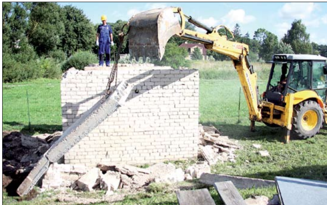
FOTO: Ūdensapgādes sistēmas rekonstrukcija Stalģenē sāka ar vecās sūkņu stacijas nojaukšanu.

Turpmāko gadu laikā ūdensapgādes sistēmu plānots sakārtot vairākos novada ciematos. Reāli darbi šobrīd sākti Jaunsvirlaukas pagasta Stalģenē un Kārņiņos, kur paredzēts gan rekonstruēt jau esošo sistēmu, gan izbūvēt jaunu vietās, kur līdz šim iedzīvotājiem nebija centralizētā ūdensvada un kanalizācijas.