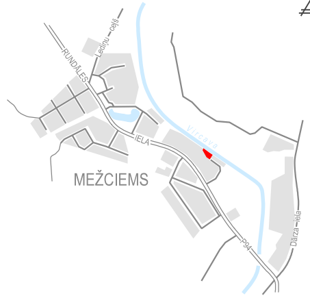
LOKĀLPLĀNOJUMA TERITORIJAS ATRĀŠANĀS VIETA