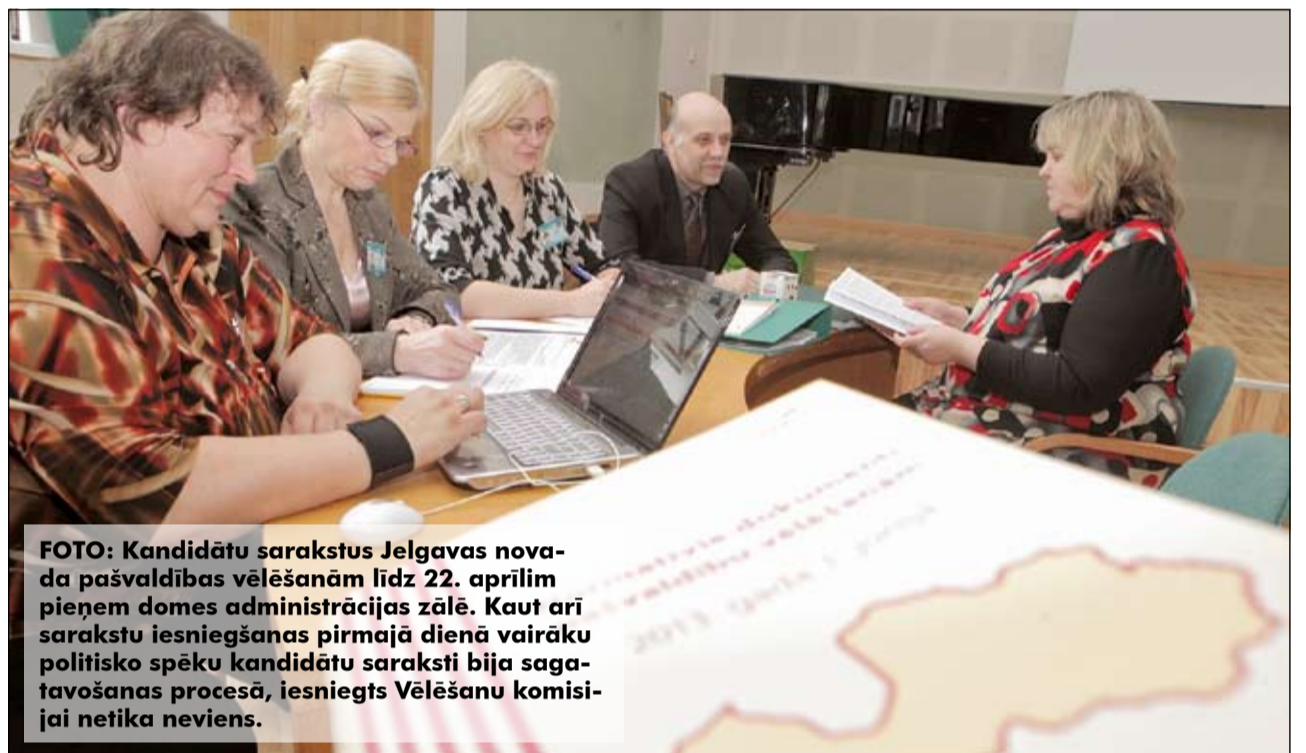
FOTO: Kandidātu sarakstus Jelgavas novada pašvaldības vēlēšanām līdz 22. aprīlim pieņem domes administrācijas zālē. Kaut arī sarakstu iesniegšanas pirmajā dienā vairāku politisko spēku kandidātu saraksti bija sagatavošanas procesā, iesniegts Vēlēšanu komisijai netika neviens.

2013. gada pašvaldību vēlēšanās vairs nav spēkā nosacījums, ka vēlēšanu zīmes iecirkņos