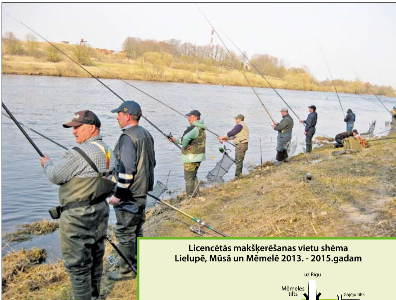
Licencētās makšķerēšanas vietu shēma Lielupē, Mūsā un Mēmelē 2013. - 2015.gadam

Ar ko jaunā licencētās makšķerēšanas kārtība atšķirsies no iepriekšējos gados pie-