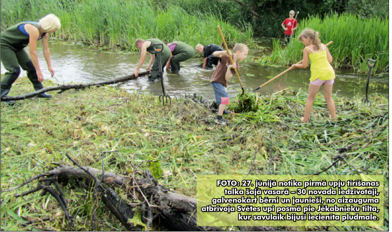
FOTO: 27. jūnijā notika pirmā upju tīrīšanas talka šajā vasarā – 30 novada iedzīvotāji, galvenokārt bērni un jaunieši, no aizauguma atbrīvoja Svētes upi posmā pie Jēkabnieku tilta, kur savulaik bijusi iecienīta pludmale.