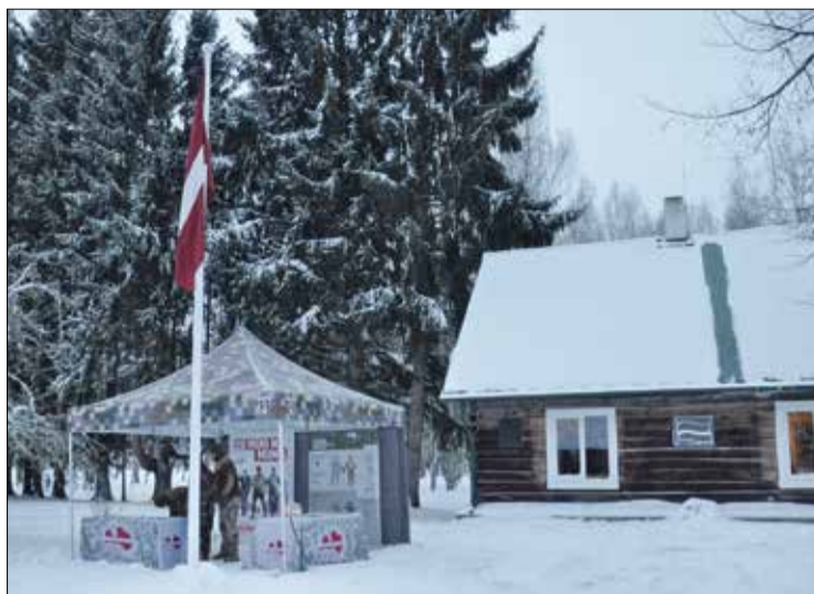
Apmeklētākie tūrisma objekti Jelgavas novadā 2016. gadā

Jāpiebilst, ka Jelgavas reģionālais Tūrisma centrs apkopojis datus arī par Jelgavas pilsētu un Ozolnieku novadu. Jelgavā pērn apmeklētākais objekts jau sesto gadu bija Svētās Trīsvienības baznīcas tornis, savukārt Ozolnieku novadā nomainīgi vairākus gadus tūristu iecienītākais ir mini zoo «Lauku sēta».