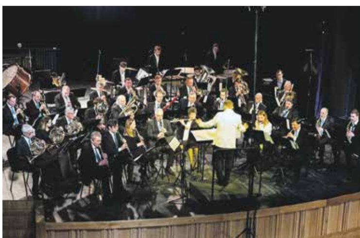
FOTO: Uz desmito gadu jubilejas koncertu ar nosaukumu «Priekā!» 27. aprīlī pulksten 18 Jelgavas kultūras namā ielūdz pūtēju orķestris «Zelmeri Pro».