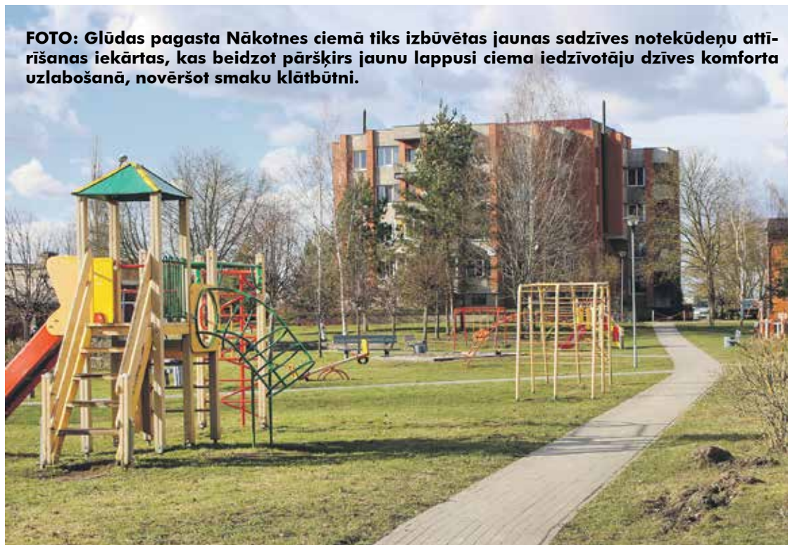
FOTO: Glūdas pagasta Nākotnes ciemā tiks izbūvētas jaunas sadzīves notekūdeņu attīrīšanas iekārtas, kas beidzot pāršķirs jaunu lappusi ciema iedzīvotāju dzīves komforta uzlabošanā, novēršot smaku klātbūtni.

Ārkārtējās situācijas garā perioda dēļ ir bremsēta Jelgavas novada teritorijas plānojuma 2019.–2023. gadam sabiedriskās apspriešanas procedūra, kas tādējādi apdraud attīrīšanas iekārtu izbūvi atbilstoši projekta laika grafikam. Tāpēc Jelgavas novada pašvaldība, kam saistoši ir gan izpildīt savas kā projekta partnera saistības,