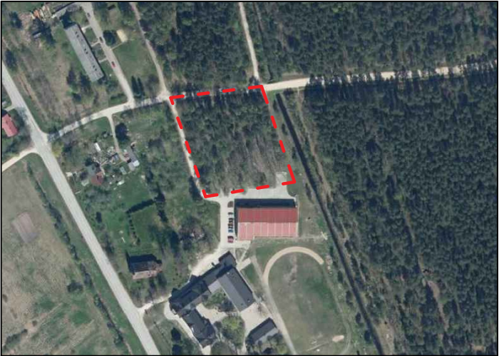
Projektējamā teritorijas robežas