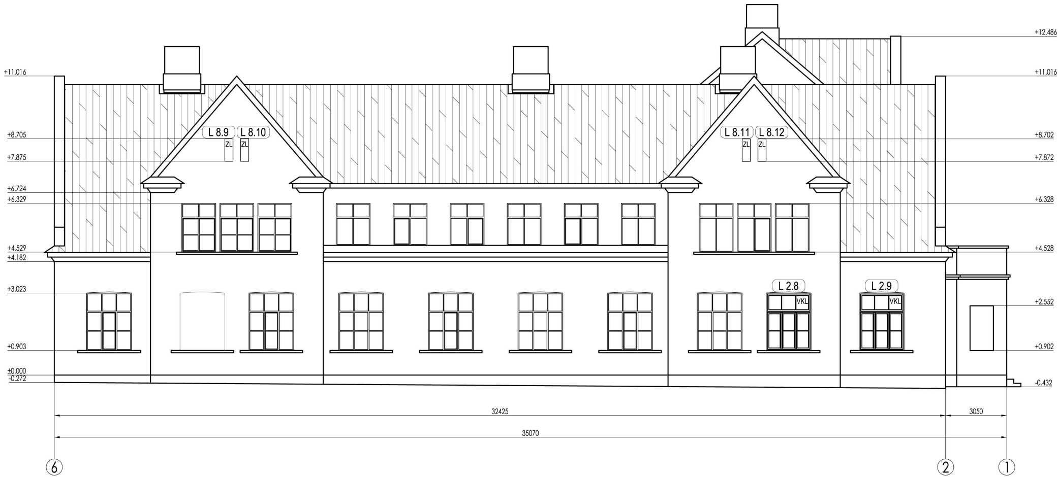
Vecās ēkas daļas projektētā situācija. Fasāde asīs 6-1; M 1:100